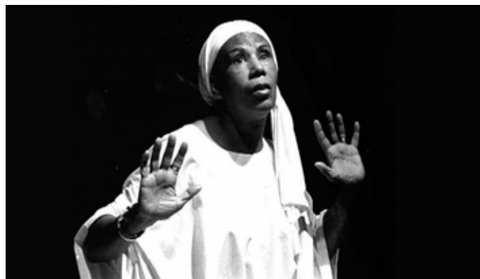
Jenny dans Kaïdara de Amadou Hampâté Bâ (1980)

Projection en salle de cinéma à 15h : Un siècle de Jenny , 52 min, documentaire réalisé par Laurent Champonnois et Federico Nicotra.