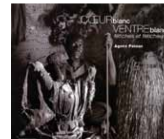
Couverture du livre

Rencontre traduite en langue des signes LSF.