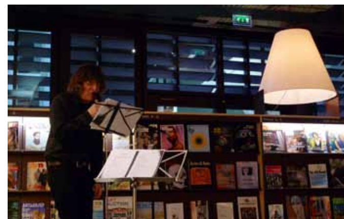
JL Debattice au salon de lecture

Le thème de cette année voguera d'île en île au sein des Outre-mer. Ces terres ont inspiré de nombreux poètes autochtones, mais aussi des voyageurs ou des exilés. Une palette riche en couleurs et climats qui s'étend des régions les plus tropicales comme les Antilles, la Guyane, la Polynésie, aux plus rudes comme Saint-Pierre-et-Miquelon. Dans ce voyage, la Nouvelle Calédonie apportera son accent particulier.