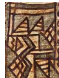
Etoffe d'écorce battue

Un documentaire de 52 mn, coproduction Mareterrani RFO Réunion France O