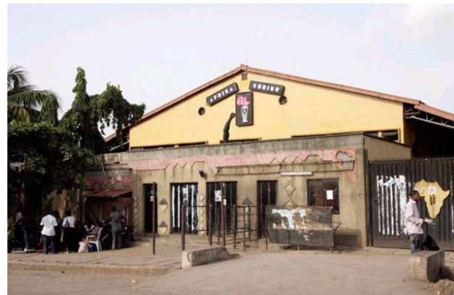
New African Shrine ouvert par le musicien Femi Kuti en 2000 dans la banlieue de Lagos

Séminaire organisé en collaboration avec Bétonsalon , centre d'art et de recherche. En savoir plus page 14.