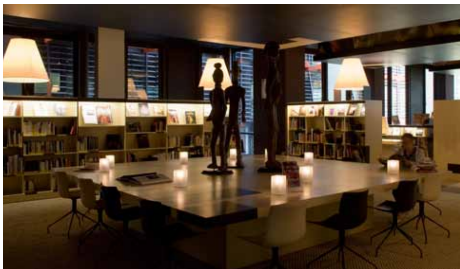
Le salon de lecture Jacques Kerchache