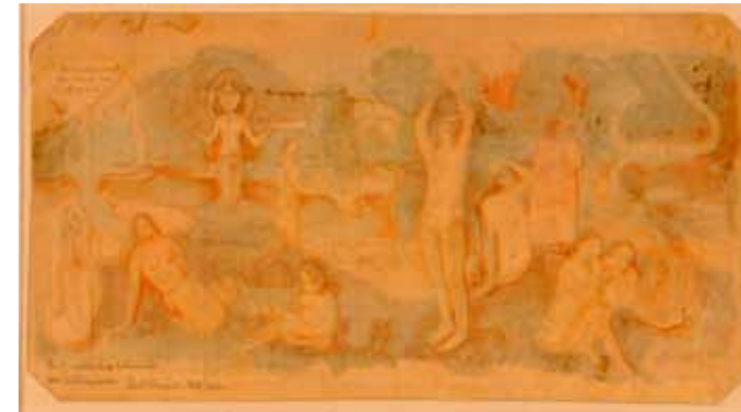
N° Inventaire : PP0181966

Pour observer de près un objet sorti des réserves, découvrir son histoire, de sa collecte à sa conservation. Rencontres traduites en langue des signes LSF ou découvertes par le toucher avec des fac-similés.